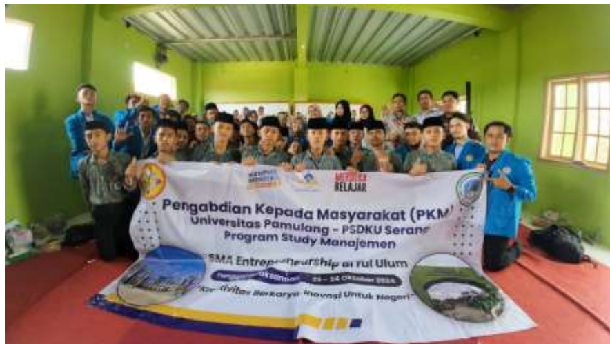
Gambar 2. Foto Bersama Siswa Siswi, Mahasiswa dan Dosen Selesai Pemaparan Materi