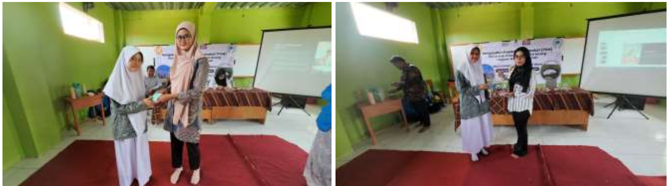
Gambar 1. Tim Memberikan Apresiasi Kepada Siswa Pada Sesi Tanya Jawab Materi