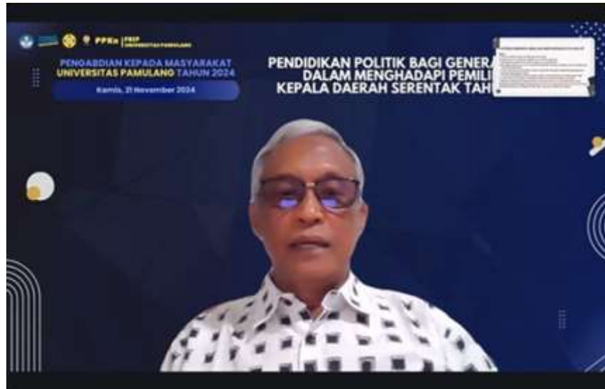
Gambar 1: Penyampaian Materi Pendidikan Politik bagi Generasi Muda

Dengan melihat hal tersebut, tim dosen Pengabdian Kepada Masyarakat semakin terdorong untuk merealisasikan pendidikan politik pada generasi muda. Dalam hal ini, tim dosen Pengabdian kepada masyarakat menyampaikan perlunya pendidikan politik dalam persiapan pemilihan kepala daerah serentak tahun 2024 yang melibatkan generasi muda sebagai pemilih pemula. Seperti yang diketahui bahwa dinamika partisipasi politik generasi muda sering berubah dengan berjalannya waktu. Banyak generasi muda yang tidak tertarik dengan masalah politik. Hal ini dikarenakan minimnya rasa percaya terhadap politik dan tokoh politik di dalamnya (Sofia & Ritonga, 2024). Oleh karena itu, pendidikan politik ini akan sangat membantu generasi muda dalam: (1) meningkatkan kesadaran politik; (2) memahami calon dan isu politik; (3) mendorong partisipasi aktif; (4) mengurangi konflik dan polarisasi; (5) membangun kualitas pemimpin; (6) meningkatkan kepercayaan terhadap proses demokrasi. Hal ini tentu menjadi bagian yang penting dan harus diperhatikan oleh generasi muda. Dengan diberikannya pendidikan politik pada generasi muda. Kemungkinan besar akan membuka kesadaran generasi muda untuk ikut serta berpartisipasi dalam politik (Indrawan & Yuliandri, 2023).