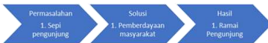
Gambar 1. Diagram Alir

Metode pelaksanaan untuk pengembangan wisata religi Makbaroh Syekh Sulthon Rafiudin melalui pemberdayaan masyarakat dapat dilakukan dengan pendekatan yang terstruktur dan melibatkan berbagai pihak yang relevan. Metode pelaksanaan dengan menggunakan Pendekatan Partisipatif dan Kolaboratif Tujuan Membentuk sistem pengelolaan yang berbasis pada keterlibatan aktif masyarakat dan stakeholder lainnya (Hamzah et al., 2020). Langkah-langkah Pembentukan Tim Pengelola Wisata Membentuk tim yang terdiri dari perwakilan pemerintah, tokoh agama, masyarakat lokal, dan ahli pariwisata untuk merencanakan dan mengelola pengembangan wisata religi. Rapat Koordinasi dan Konsultasi Publik Menyelenggarakan rapat koordinasi dengan masyarakat untuk mendiskusikan rencana pengembangan dan mendengarkan masukan dari mereka. Hal ini memastikan partisipasi aktif dan mendalami kebutuhan masyarakat. Pembentukan Kelompok Kerja Masyarakat Membentuk kelompok kerja yang bertugas dalam aspek-aspek tertentu, seperti pemandu wisata, pengelola fasilitas, dan pemasaran. Output yang diharapkan Masyarakat merasa memiliki dan bertanggung jawab atas pengelolaan, yang akan menciptakan keberlanjutan dalam pengelolaan wisata (Saladin Azis, 2023).