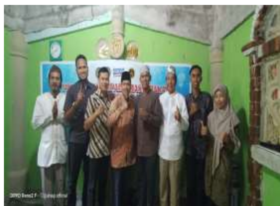
Gambar 1: Tim PKM Dosen UNIBA Makbaroh Syekh Sulthon Rafiudin