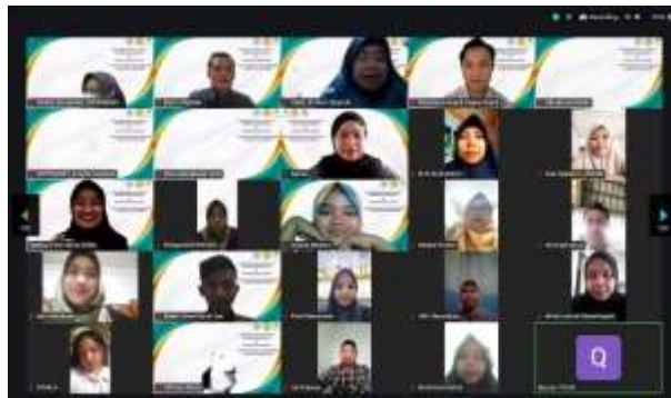
Gambar 3: Peserta kegiatan pengabdian kepada masyarakat

Kegiatan ini juga menciptakan jaringan akademik yang lebih luas, dengan melibatkan 37 perguruan tinggi dari berbagai provinsi, yang membuka peluang kolaborasi di masa mendatang. Jaringan ini sangat penting dalam memperkuat sistem pendidikan di Indonesia, di mana kolaborasi antar perguruan tinggi dapat meningkatkan kualitas pendidikan secara keseluruhan.