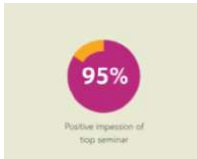
Diagram 2: Respon positif peserta terhadap kegiatan

Hasil survei pasca-kegiatan, yang dilakukan melalui Google Form, mengungkapkan bahwa hampir seluruh peserta merasa puas dengan materi dan penyampaian yang diberikan sebagaimana diagram di bawah ini.