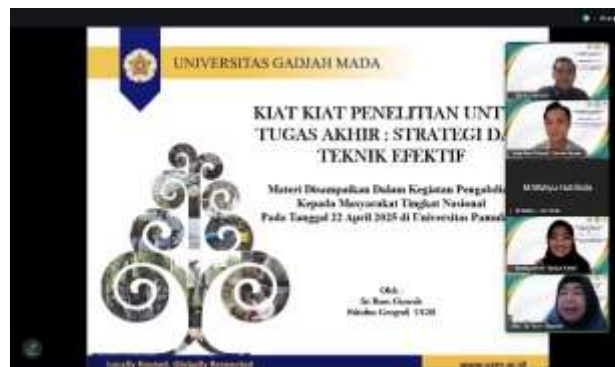
Gambar 1: Penyampaian materi oleh pembicara

Kegiatan pengabdian kepada masyarakat yang diselenggarakan oleh Universitas Pamulang dan Universitas Gadjah Mada pada tanggal 22 April 2025, berhasil mencapai berbagai tujuan yang telah ditetapkan. Kegiatan ini bertujuan untuk memberikan pengetahuan dan keterampilan yang diperlukan bagi mahasiswa dalam menyusun tugas akhir, khususnya dalam hal metodologi penelitian. Dalam webinar yang dihadiri oleh 415 mahasiswa dari berbagai perguruan tinggi di Indonesia, materi disampaikan oleh Prof. Dr. Sri Rum Giyarsih, M.Si. yang membahas strategi dan teknik efektif dalam menyusun tugas akhir sebagaimana yang tertera pada gambar berikut.