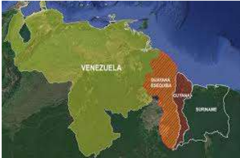
Gambar 1. Peta Sengketa Wilayah Essequibo

Peta sengketa wilayah Essequibo juga dikenal sebagai Guayana Esequiba menampilkan wilayah seluas sekitar 159.500 km 2 (sekitar 61.600 mil 2 ), yang mencakup lebih dari dua pertiga total wilayah Guyana. Wilayah ini terletak di sebelah barat Sungai Essequibo, berbatasan langsung dengan Venezuela di barat, Brasil di selatan, dan Samudra Atlantik di utara. Dalam peta resmi yang digunakan oleh Pemerintah Venezuela, wilayah ini ditandai sebagai "zona en reclamación", yaitu zona yang diklaim dan direncanakan untuk dianeksasi sebagai bagian dari kedaulatan negara. Sebaliknya, peta resmi Guyana menunjukkan bahwa wilayah Essequibo merupakan bagian integral dari negaranya, yang telah dikelola secara administratif sejak keputusan arbitrase Paris tahun 1899 dan ditegaskan kembali setelah kemerdekaan Guyana pada tahun 1966. Peta-peta ini menggambarkan kompleksitas historis dan geopolitik dari klaim yang saling tumpang tindih antara Venezuela dan Guyana, serta menegaskan pentingnya wilayah ini secara strategis karena ditemukannya cadangan minyak dan gas alam di wilayah pesisir Essequibo.