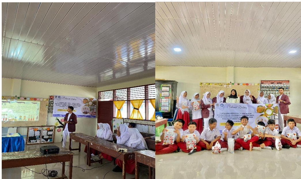
Gambar 1: Tim Memberikan Materi Pentingnya Sarapan Pagi

Belajar merupakan suatu proses yang kompleks dan melibatkan perubahan perilaku, pemahaman, dan keterampilan sebagai hasil dari pengalaman, latihan, atau juga pengajaran. Ada berbagai faktor yang menjadi pengaruh dalam proses belajar diantaranya termasuk motivasi, lingkungan, dan juga kesehatan fisik siswa. Kesehatan mempengaruhi proses belajar siswa karena apabila siswa sehat dan mendapatkan nutrisi yang cukup, termasuk sarapan yang baik, berpotensi memiliki motivasi dan energi yang jauh lebih tinggi untuk belajar. Mengingat dengan adanya bukti-bukti penelitian yang telah dilakukan sebagai penguat dan sebagai referensi. Hal ini menjadi indikasi bahwa kesehatan fisik dan kebiasaan makan yang baik memberikan kontribusi pada sikap positif dalam proses pembelajaran (Isnaeni Agustina, 2025).