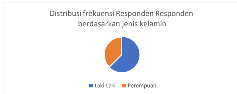
Gambar 8. Distribusi frekuensi Responden Responden berdasarkan jenis kelamin (2025)

Kegiatan ini diikuti oleh 63% laki laki dan 37% perempuan yang berusia produktif kurang dari 20 Tahun