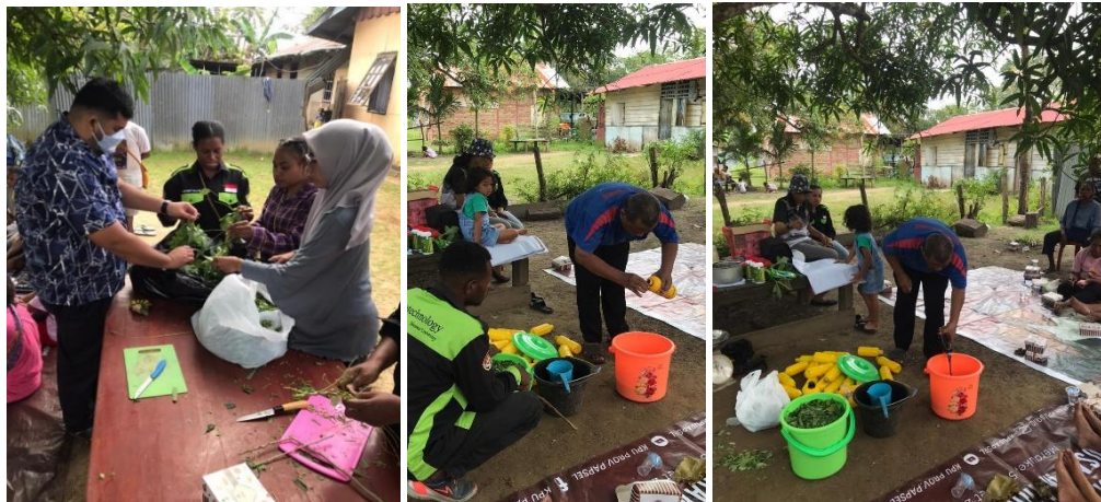
Gambar 2. Proses Pembuatan Pupuk Organik Cair (POC)

Pada kegiatan ini pembuatan pupuk organik cair menggunakan tanaman gamal dan papaya hal ini dikarenakan selain banyak terdapat di wilayah Merauke, tanaman gamal juga merupakan tanaman yang mengandung unsur hara yang sangat tinggi. Hal ini juga selaras dengan pernyataan dari (Razali & Fithria, 2023) yang menyatakan bahwa gamal termasuk kedalam Famili Leguminosae yang memiliki kandungan hara esensial yang tinggi. Pernyataan ini juga dikemukakan oleh (Seni et al., 2013) gamal dengan satu tahun diketahui mengandung Nitrogen (N) sebesar 3–6%, Fosfor (P) sebesar 0,31%, Kalium (K) sebesar 0,77%, serta serat kasar berkisar antara 15–30%.