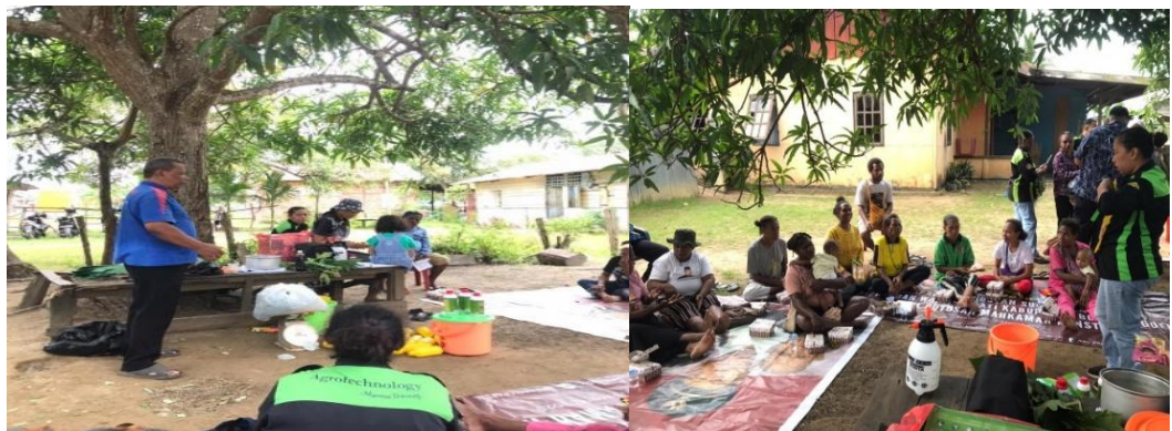
Gambar 1. Proses sosialisasi mengenai pupuk organik cair (POC)

Melalui kegiatan sosialisasi ini, peserta memperoleh pengetahuan teoritis yang komprehensif mengenai peran POC dalam mengurangi ketergantungan terhadap input anorganik serta mendukung sistem pertanian ramah lingkungan.