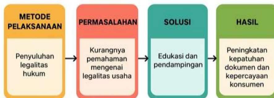
Gambar 1. Diagram Alir